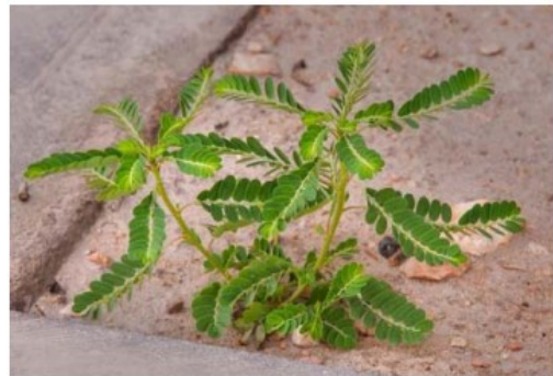
Gambar 1. Phyllanthus niruri (Meniran) (Kamruzzaman and Hoq, 2016)

Meniran merupakan herba yang berasal dari genus Phyllanthus dengan nama ilmiah Phyllanthus niruri Linn. Tumbuhan ini mengandung beberapa konstituen fitokimia seperti alkaloid dan fenol yang tinggi, flavonoid, terpenoid, steroid, cardiac glycosides , saponin, tanin, glikosida dan sianogenik. Analisis menunjukkan bahwa P. niruri mengandung kandungan karbohidrat dan serat yang tinggi. Beberapa senyawa kimia yang penting diisolasi dari Phyllanthus niruri seperti phyllanthin , hypophyllanthin , niranthin , nirtetralin , phyltetralin , phyllangin , nirphilin , phyllnirurin dan corilagin . Senyawa ini bertanggung jawab atas beberapa kegiatan farmakologis. Tanaman P. niruri ini mengandung saponin dan tanin dengan tingkat tinggi dan glikosida sianogen yang rendah (Danladi et al. , 2018).